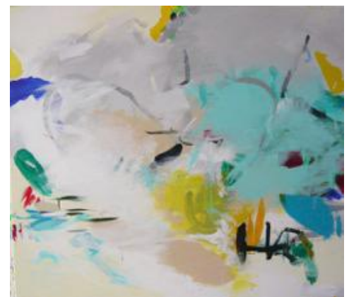
Acryl auf Leinwand – 100 x 115 cm